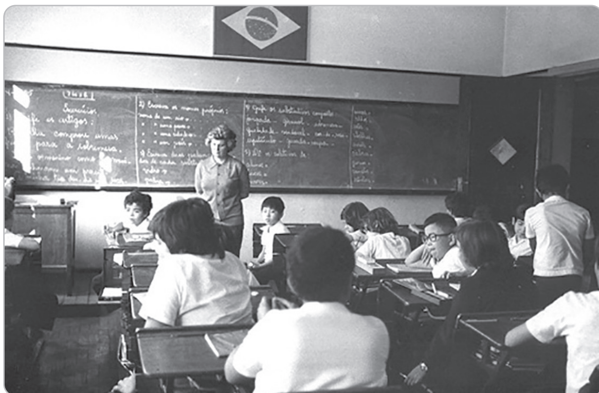
Figura 2.3 – Exemplo de sala de aula nas escolas brasileiras durante a ditadura militar.

Em outubro de 1966, o então presidente Castelo Branco assina o decreto que cria a Comissão do Livro Técnico e do Livro Didático (COLTED). Entre as bases que estruturam esse decreto, consta que “deve o Estado manter-se numa atitude ao mesmo tempo atuante e vigilante, cabendo-lhe participar diretamente, quando necessário, da produção e distribuição de livros dessa natureza”. (BRASIL, 1966, n.p)