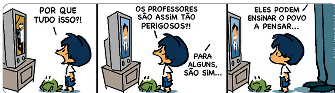
Figura 2.5 – Charge demonstrando a relevância da educação.

É inegável a relevância que o estudo da sociedade, do espaço e de suas transformações ao longo do tempo tem para uma compreensão crítica acerca da realidade. Os professores, em todas as etapas da educação, têm papel fundamental para que isso seja possível. A tirinha a seguir nos faz refletir acerca dessa importância.