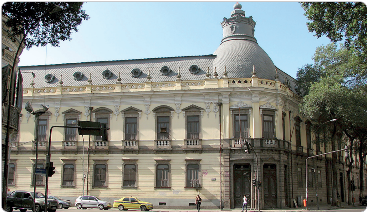
Figura 2.1 – Colégio Dom Pedro II no Rio de Janeiro.

Art.3º - Neste collegio serão ensinadas as linguas latina, grega, franceza e ingleza; rhetorica e os principios elementares de geographia, historia, philosophia, zoologia, meneralogia, botanica, chimica, physica, arithmetica, algebra, geometria e astronomia. (BRASIL, 1837, p. 60).