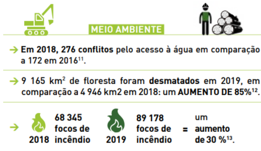
Infográfico 3 - Crise ambiental e de direitos humanos 2018 - 2019

Fonte: Coalition Solidarité Brésil (2020).