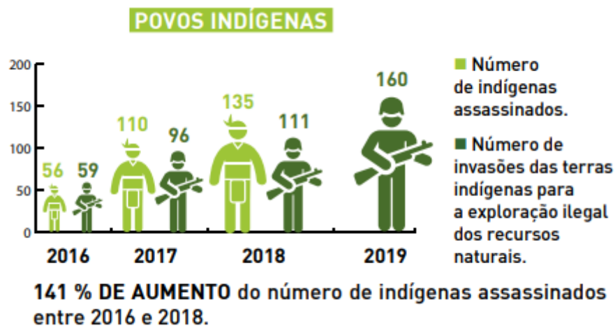
Infográfico 2 - Violações de direitos dos povos indígenas 2016 - 2019

Fonte: Coalition Solidarité Brésil (2020).