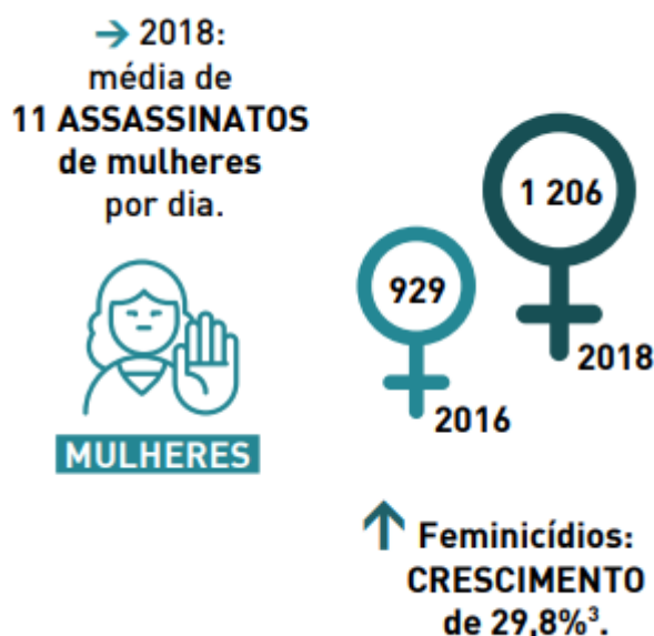
Infográfico 4 - Violações de direitos das mulheres 2016 - 2018

Fonte: Coalition Solidarité Brésil (2020).