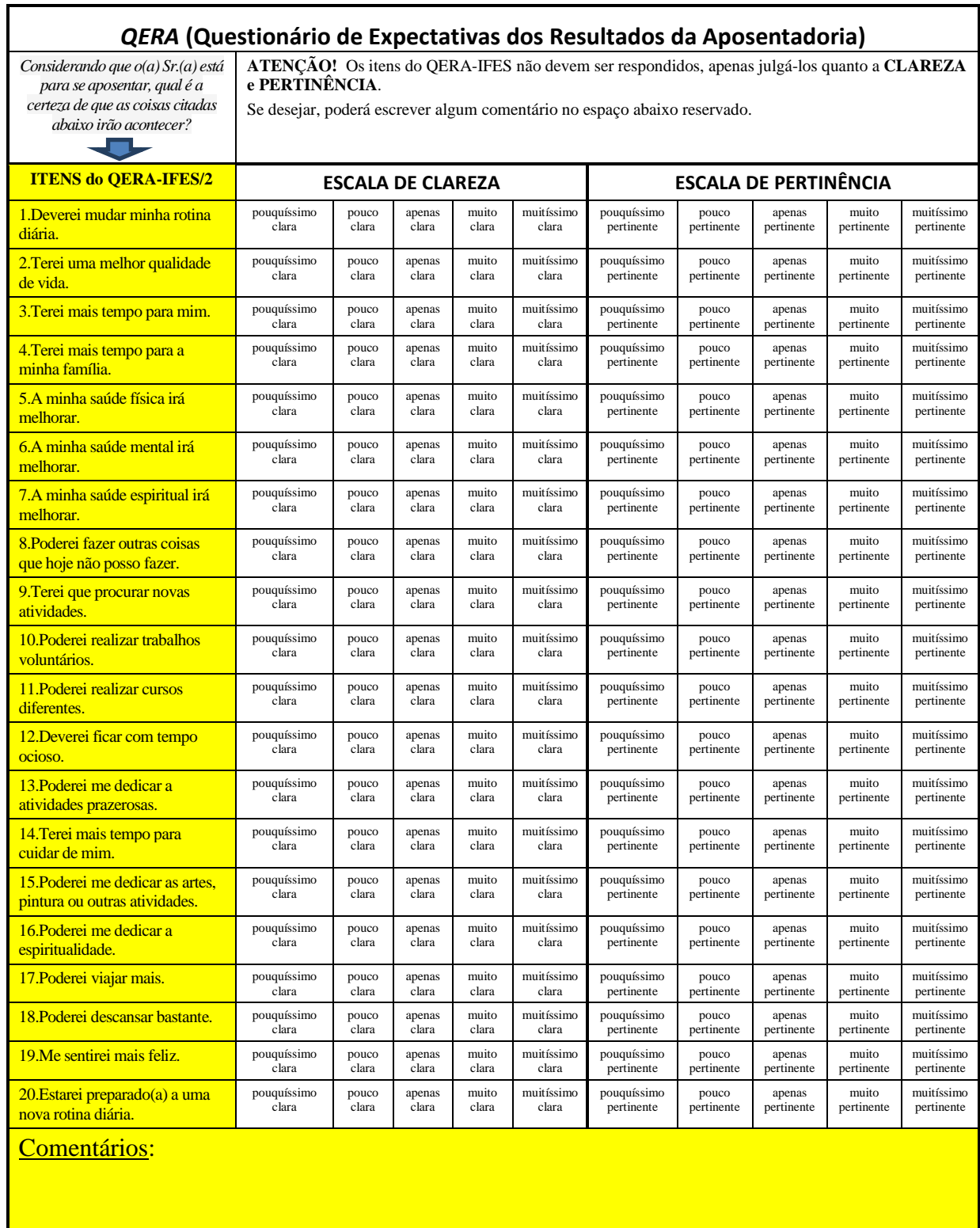
Quadro 3 - QERA-IFES/2 (O produto técnico)