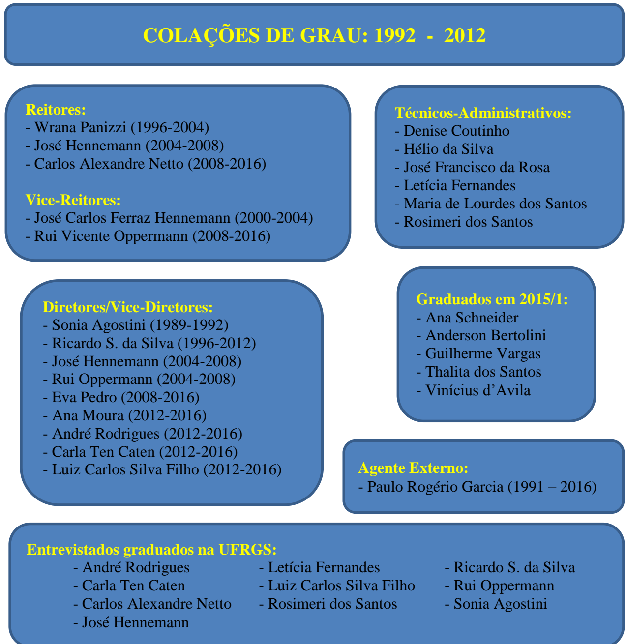
Figura 1 – Esquema da relação dos entrevistados com as solenidades

que o(s) entrevistado(s) estaria(m) livre(s) para expor(em) sua opinião(ões) com a previsão de extrapolar as perguntas previstas, bem como, não seria necessário seguir a ordem estabelecida dos questionamentos.