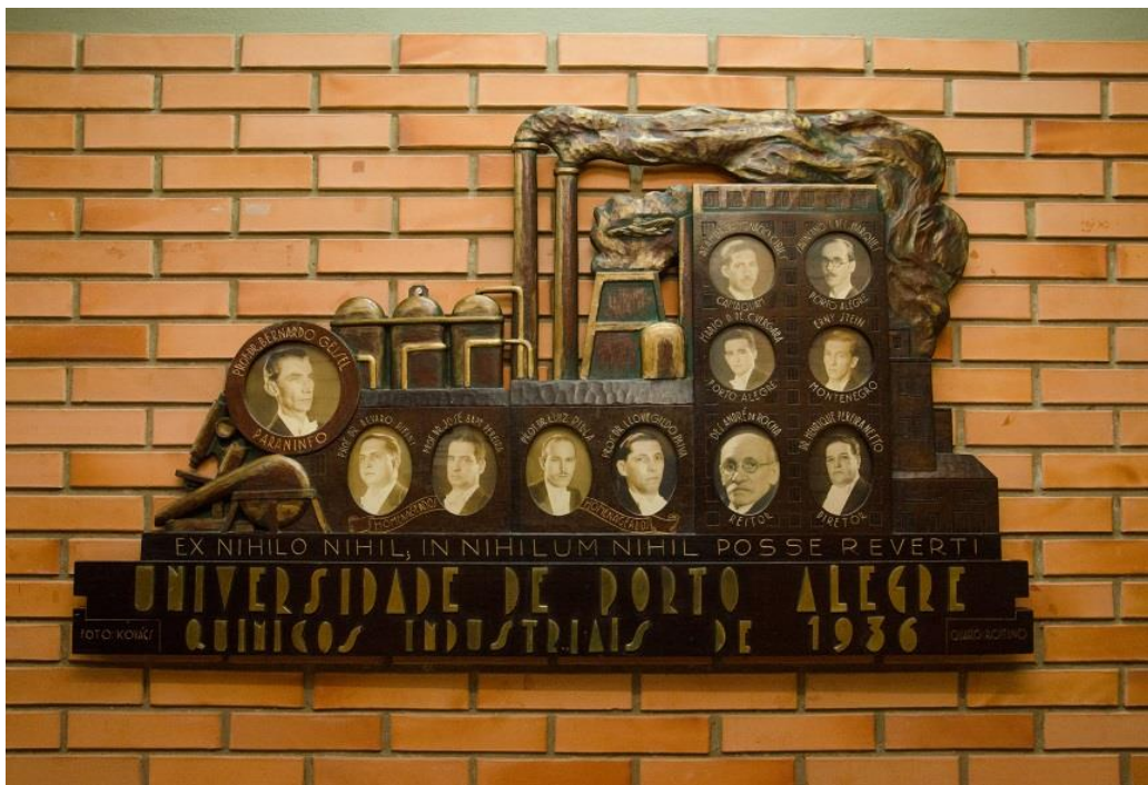
Ilustração 2 – Quadro de concludentes da Engenharia com a referência “Universidade de Porto Alegre” Graduados do Curso de Engenharia – 1936

[...] o Estado não é órgão para prover a educação. Quando muito, poderá incumbir-se de ministrar o ensino primário, leigo e gratuito. Os ensinos secundário e superior são de responsabilidade comunitária e confessional... Nesse particular cabe apenas ao Governo secular, prudentemente, a iniciativa privada (SILVA, 1992, p. 30).