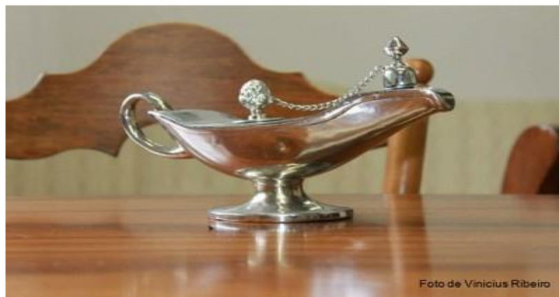
Figura 3 – Imagem da Lâmpada – símbolo da Enfermagem 28

Esta enfermeira, conforme Agostini, “na guerra da Crimeia, como não existia energia elétrica, para ela enxergar os soldados feridos ela usava uma lâmpada, tipo um candeeiro, era a iluminação do atendimento, ou seja, alguém com aquela lâmpada no escuro chegava para prestar assistência” (24/09/2015). Por esta razão, a lâmpada é o símbolo da Enfermagem, a “lâmpada é o nosso símbolo maior”, significando a “luz na escuridão do sofrimento” (24/09/2015).