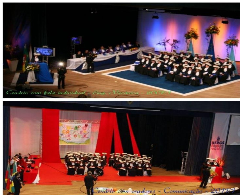
Figura 6 – Disposição dos elementos e símbolos na colação de grau.

Na UFRGS, o espaço físico de realização das solenidades é o Salão de Atos, e nos dias de realização destas solenidades, desde que foi o Salão reinaugurado, a localização dos elementos tem se mantido no mesmo formato como forma de organização e identificação da cerimônia. Inclusive, nos ensaios que precedem a realização das solenidades, os elementos imóveis já são localizados no ambiente do Salão, a fim de que se aproxime o máximo possível do que acontecerá no dia da colação de grau. Na imagem a seguir, identificou-se a disposição no ambiente: