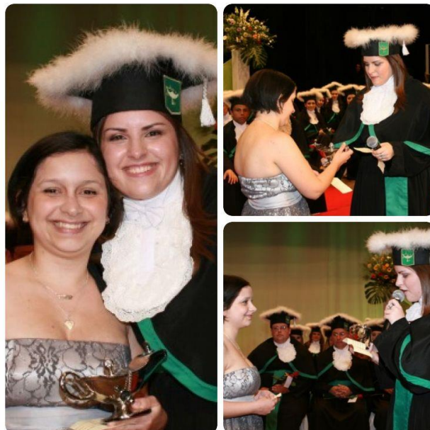
Figura 5 – Colação de grau da Enfermagem 2009/1 – Ritual de Passagem da Lâmpada 79

Os rituais oportunizam a visualização de momentos de transmissão de valores e de conhecimentos entre o grupo e para quem assiste, além de reproduzir as relações sociais (PEIRANO, 2003). Transformado em ritual, o símbolo, neste caso a lâmpada, passou a ter o sentido renovado na cerimônia e Pedro descreveu o ritual da lâmpada adotado “[...] um aluno que está se formando passa (a lâmpada) para o aluno que vai ser formar no próximo semestre, e o que passa diz: vai manter acesa a chama que ilumina os ideais da nossa profissão ” (24/09/2015).