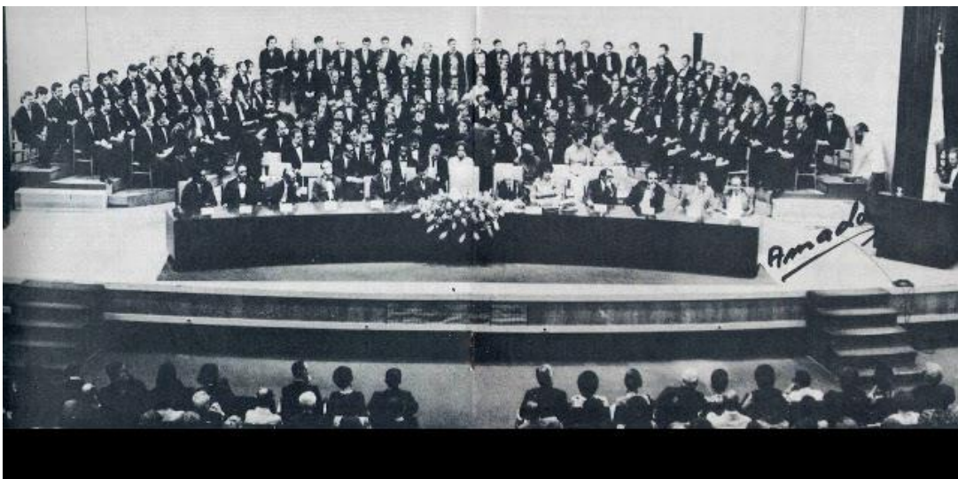
Figura 4 – Solenidade de Colação de Grau da turma de Engenharia Elétrica no Salão de Atos da UFRGS (1971)