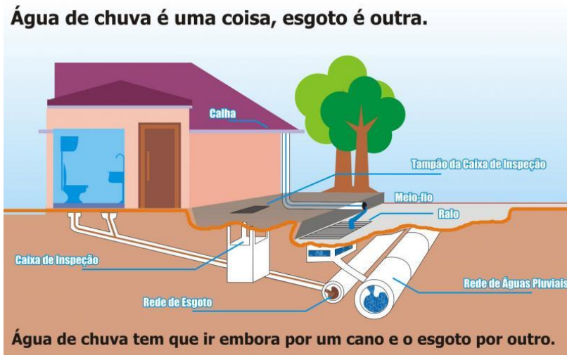
Figura 1 – Sistema privado de esgoto