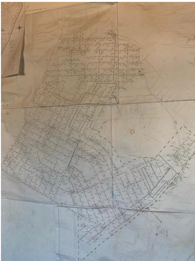
Figura 3 – Projeto rede de esgoto Gravataí- RS